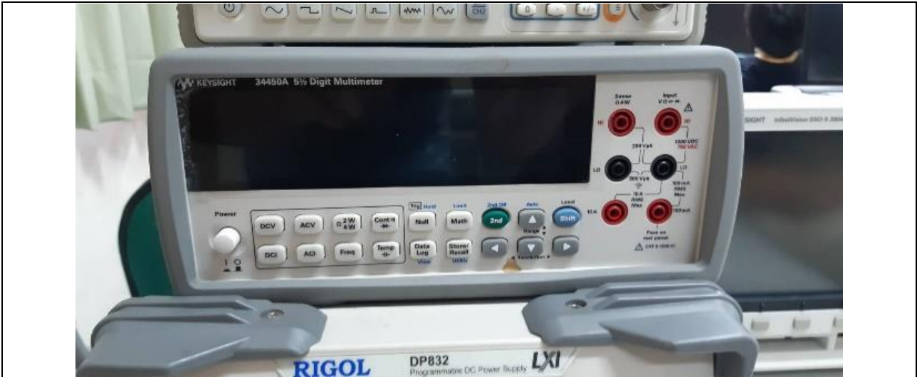
桌上型三用電錶（型號：Keysight 34450A）