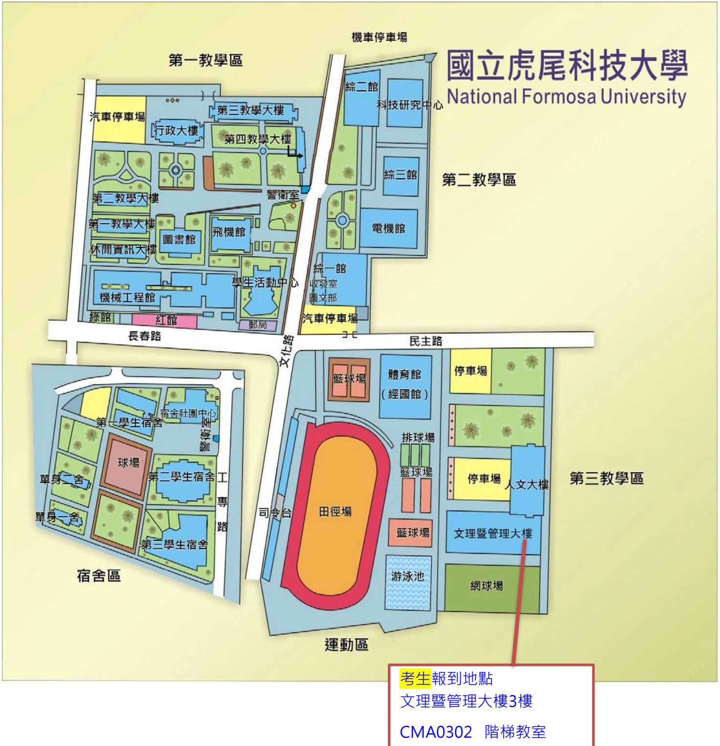
國立虎尾科技大學工業管理系校內示意圖