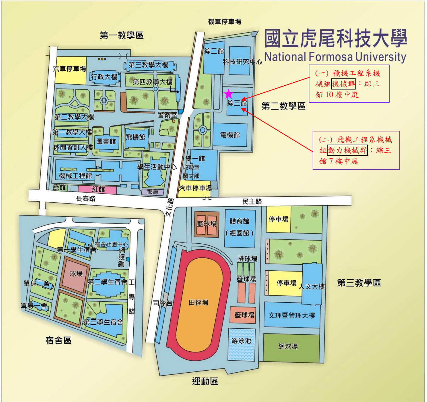
國立虎尾科技大學飛機工程系校內示意圖