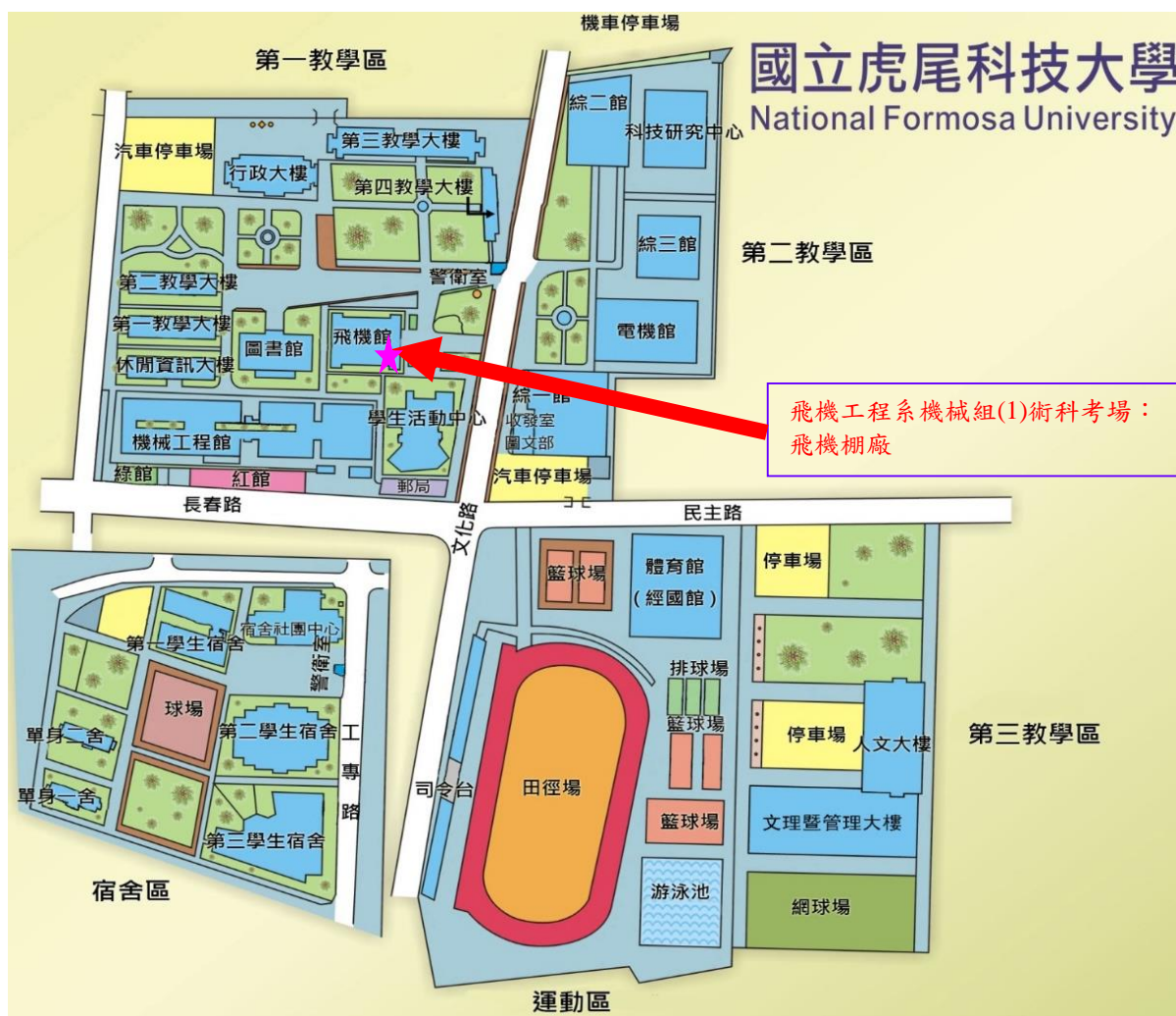
國立虎尾科技大學飛機工程系校內示意圖