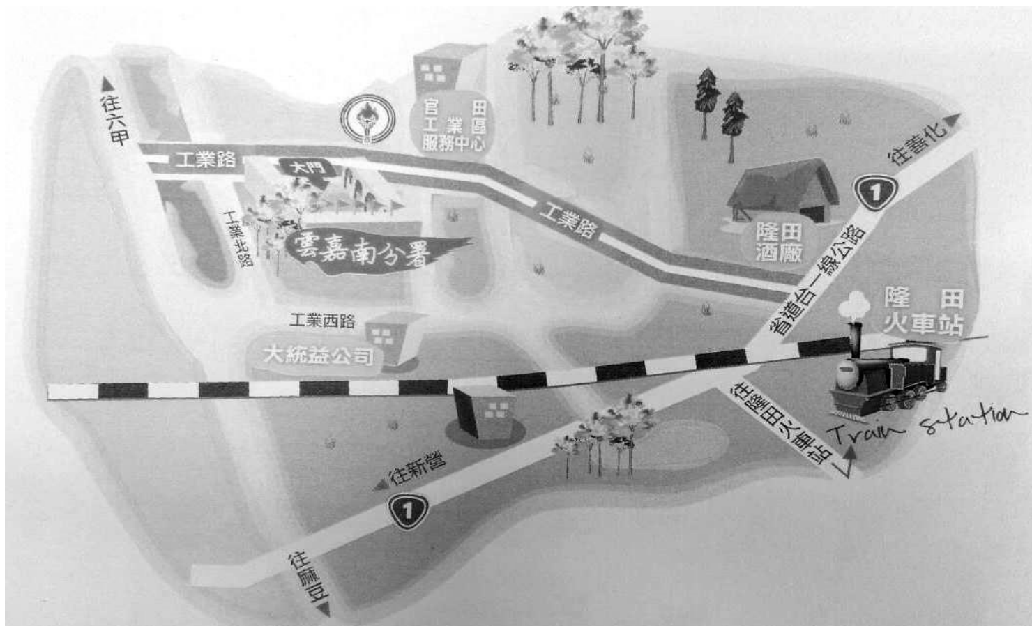
勞動部勞動力發展署雲嘉南分署交通示意圖

勞動部勞動力發展署雲嘉南分署：72042 臺南市官田區官田工業區工業路 40 號