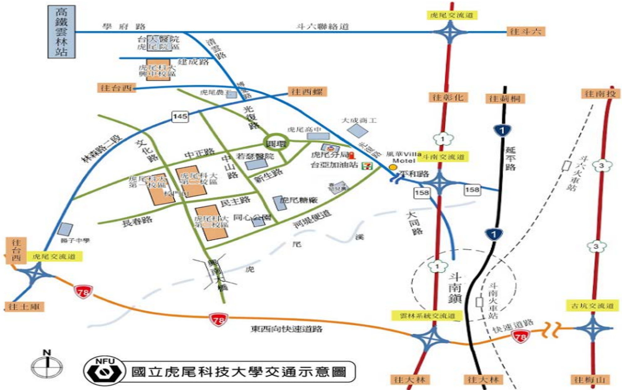
NFU 國立虎尾科技大學交通示意圖